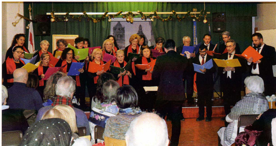
Sabato 15 dicembre: Concerto di Natale del coro "Aurelio Rossi"