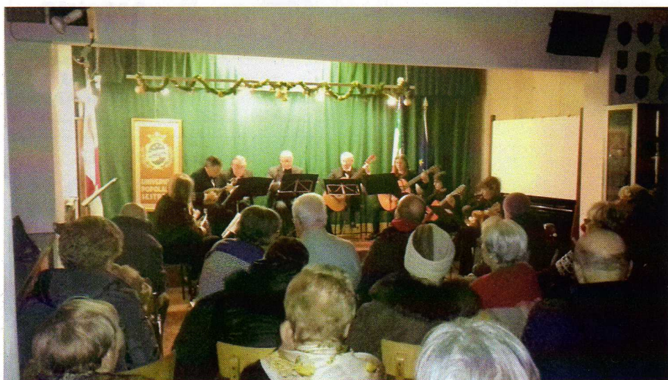
Sabato 22 dicembre: Concerto di Natale dell'Ensemble a pizzico "A. Vivaldi"