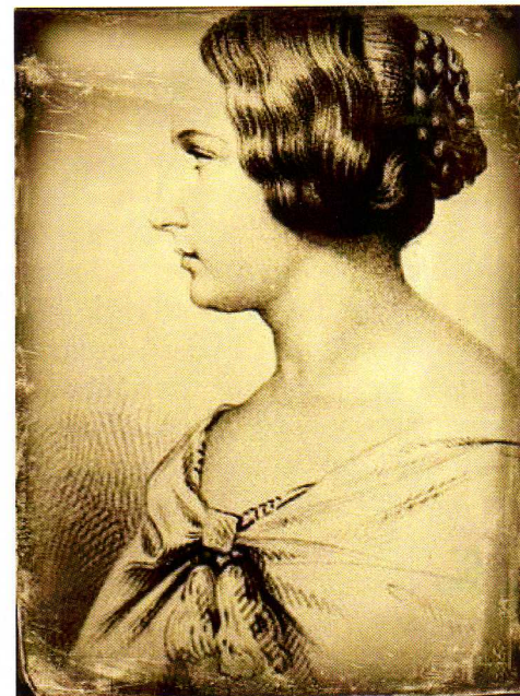
la principessa Dora d'Istria

(...) "I dotti come Pareto, Barelli, Lessona, Canestrini e Pescetto hanno riconosciuto che sul litorale di Pegli, di Multedo, di Sestri (questo Sestri non è da confondere con quello dove mette capo sulla riviera di Levante una strada di ferro la cui costruzione durerà più dell'assedio di Troia) e di Cornigliano si trova una sabbia ferruginosa che fa deviare l'ago della bussola anche ad una certa distanza. Ai tempi di Napoleone I gl'ingegneri esplorarono i monti che dominano questo lato da Pegli a Cornigliano e furono sorpresi dalla deviazione dell'ago delle loro bussole. Le cause che le alterano agiscono sul ferro che viene con loro travolto nei torrenti. La trasformazione della spiaggia si spiega del pari con la lenta degradazione degli Appennini. Alla Spezia è già formata un'intera pianura. Anche sulla riviera di